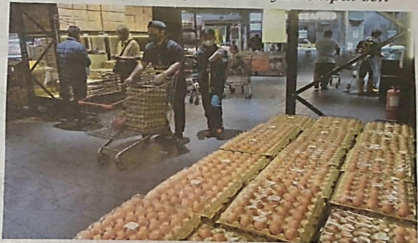
ORANG ramai membeli telur ayam di sebuah pasar raya di Shah Alam.