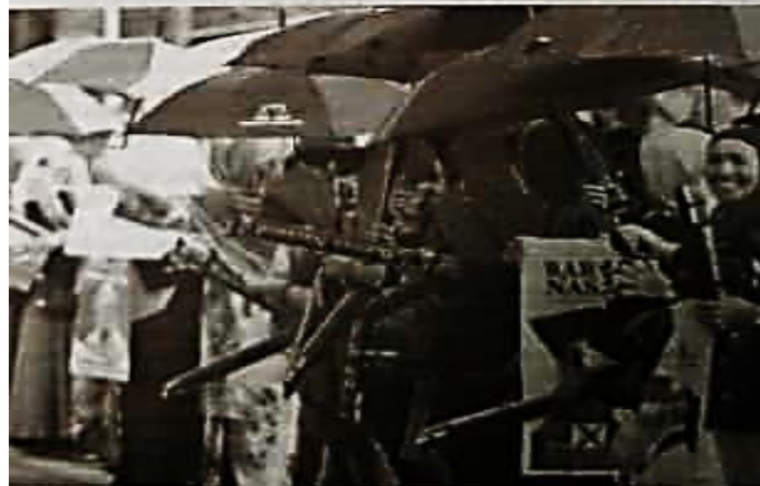
TIADA jaminan pandemik inflasi dapat diselesaikan selepas diadakan PRU15.