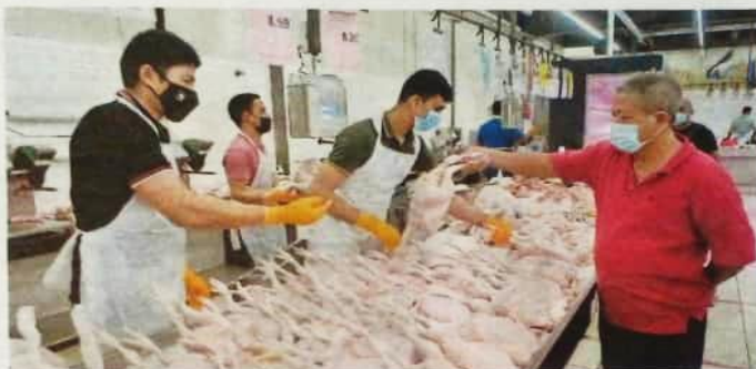
A customer buying chicken at a supermarket in Shah Alam yesterday.

ernment didn't go ahead with the initial plan to remove the subsidies for chicken and eggs," he said, adding that floating the price for standard chicken would see it soaring to as high as RM12 per kg.