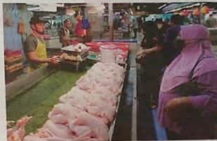
KERAJAAN menetapkan harga siling baharu di Semenanjung Malaysia bagi ayam bulat standard pada RM9.40 sekilogram.

KPDNHEP berkata, harga siling baharu itu adalah manifestasi keprihatinan kerajaan untuk membantu mengurangkan bebanan kos sa-