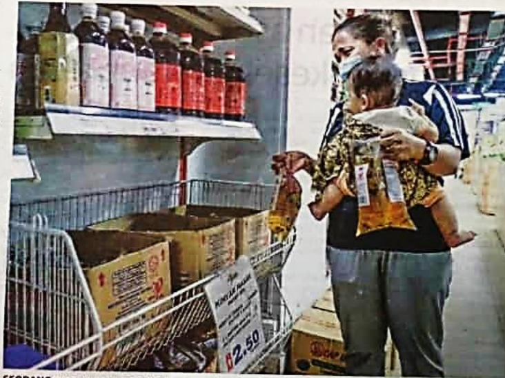
• SEORANG pengguna mengambil minyak masak peketa di sebuah pasar raya di Chow Kit, semalam. Hanya minyak masak peketa diberi subsidi kerajaan dan dijual pada harga RM2.50 sekilogram.

Harga siling runcit telur ayam pula pada kadar 0.45 sehingga 0.51 sen sebiji bagi gred A, Gred B (0.43 sehingga 0.50 sen/biji) dan gred C (0.41 sehingga 0.49sen/biji).