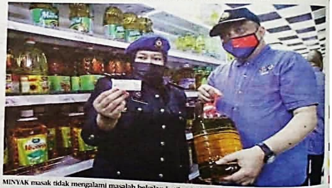
MINYAK masak tidak mengalami masalah bekalan ketika siling...

"Kita boleh lihat pertambahan stok selepas tengah hari ini (semalam) selepas pengilang siap mengedarkan minyak masak berke-