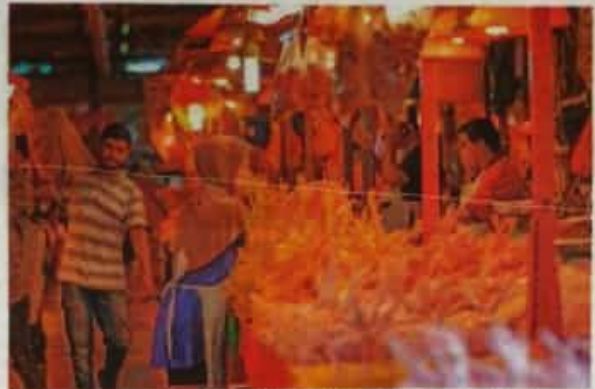
Harga siling ayam standard pada kadar RM9.40 per kilogram memberi kelonggan kepada rakyat khususnya golongan B40.

"Selain itu, bekalan bekurang sangat ketatan negara pada dalam memastikan bekalan bagi mengimbangi bekalan yang ditelan," katanya.