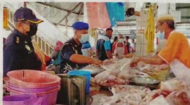
KPDNHEP Perak menggerakkan 176 penguat kuasa susulan penguatkuasaan Penentuan Harga Maksimum Ayam dan Telur Ayam mulai 1 Julai 2022 hingga 31 Ogos 2022 dan pengapungan harga minyak masak tulen botol di pasaran.